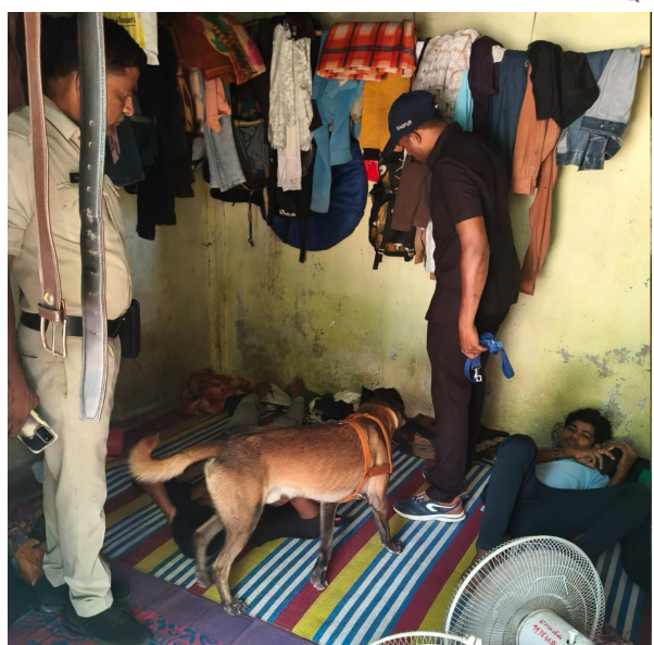
- జాతీయ రహదారి వెంటల హోటల్స్, దాబాలు, విద్యాసంస్థల్లో తనిఖీలు