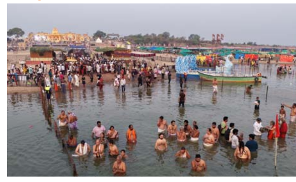
ప్రాంతంగా కాళేశ్వరం ప్రసిద్ధి చెందింది. దేశంలో సరస్వతీ నది ఉన్నది ఉత్తరప్రదేశ్ లోని ప్రయాగ్ కారం, రెండోది కాళేశ్వరంలోనే. అక్షరం కుంభమేళా నిర్వహించడం అనవాయితీ. కాగా, తెలంగాణలో తొలిసారి అంత్య పుష్కరాలకు సైతం ప్రాధాన్యమిచ్చి ఘనంగా నిర్వహించేందుకు ఏర్పాట్లు చేయటం విశేషం.