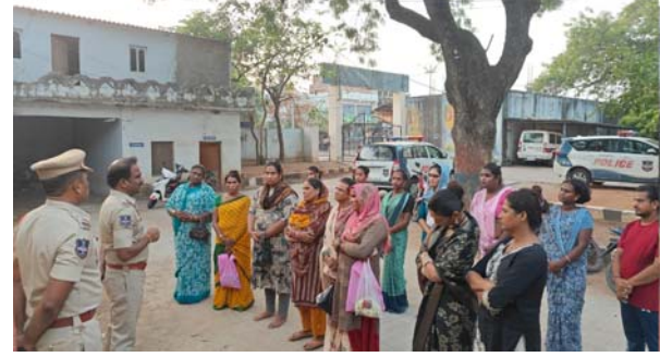
డబ్బుల కోసం వేధింపులకు గురి చేస్తే వెంటనే పోలీసులకు సమాచారం అందించాలని కోరారు.