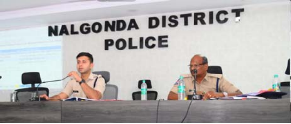
- పెండింగ్ కేసులు లేకుండా వేగంగా దర్యాప్తు పూర్తి చేయాలి -- జిల్లా ఎస్పీ ఆదేశం