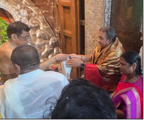
తేదీ 12-05-2026 మంగళవారం రోజు శ్రీ హనుమాన్ జయంతి నిర్వహించారు. శ్రీ సంజీవ్ మాత ఆలయంలో కల శ్రీ అంజనేయ శ్రీ హనుమాన్ చాలీసా పారాయణం జరిగింది. ముఖ్య అతిథిగా శ్రీ కంచెర్ల గోపన్న (శ్రీ భక్తరామదాసు) గారి 11వ తరం వంశీకులు ఉత్సవాలు భాగ్యనగరంలోని వివిధ దేవాలయాలలో ఘనంగా నిర్వహించారు. శ్రీ సంజీవ్ మాత ఆలయంలో కల శ్రీ అంజనేయ స్వామికి పంచామృతంతో అభిషేకం, సింధూర పూజలు, 108 మార్లు